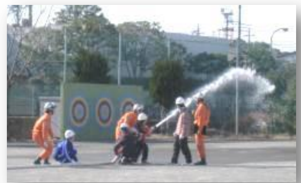
中学生チームの放水訓練の様子

災害が起きた時、自分で身を守る術を身につけておくことが改めて大切だと実感しました。